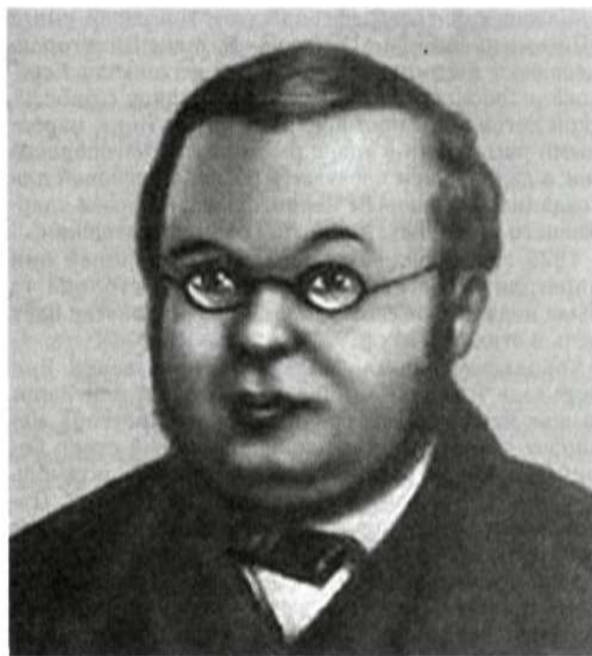
Пётр Павлович Ершов