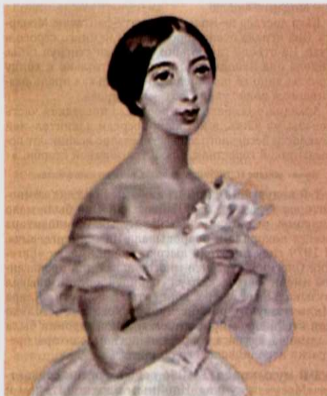
Портрет певицы Полины Виардо Гарсия (Карл Брюллов, 1844 г.)

«Севильского цирюльника» и видеть ее в роли Розины!» Здесь же Боголюбов выразительно описывает внешность певицы: «Виардо не была хороша собой, но была стройна! У нее до старости были чудные черные волосы, умные бархатные черные глаза и матовый цвет лица... Рот ее был большой и безобразный, но только она начинала петь, о недостатках лица и речи не было. Она буквально вдохновлялась, являясь такую красавицею... такой актрисой, что театр дрожал от рукоплесканий и браво. Цветы сыпались на сцену».