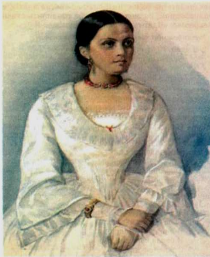
А. Я. Панаева (К. А. Горбунов, 1841 г.)

В лирике традиционно сопоставление состояния природы и настроения человека. Особенность некрасовской лирики природы в том, что поэт вносит в описание природы обострённую социальную чуткость. Мы постоянно ощущаем присутствие